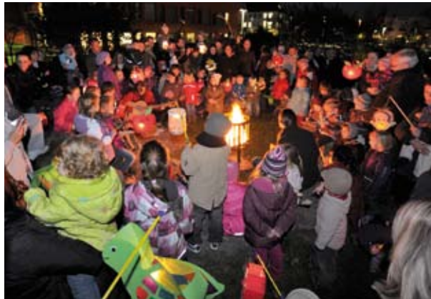
Laternenfest am 9.11.2011 mit Besuch im Seniorenzentrum