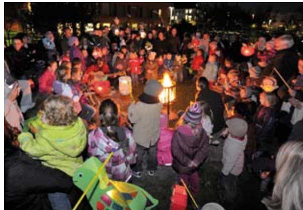
Laternenfest am 9.11.2011 mit Besuch im Seniorenzentrum